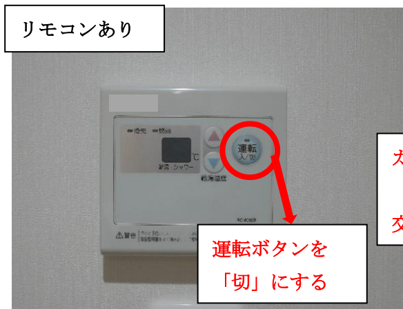
リモコンあり：運転スイッチ「切」